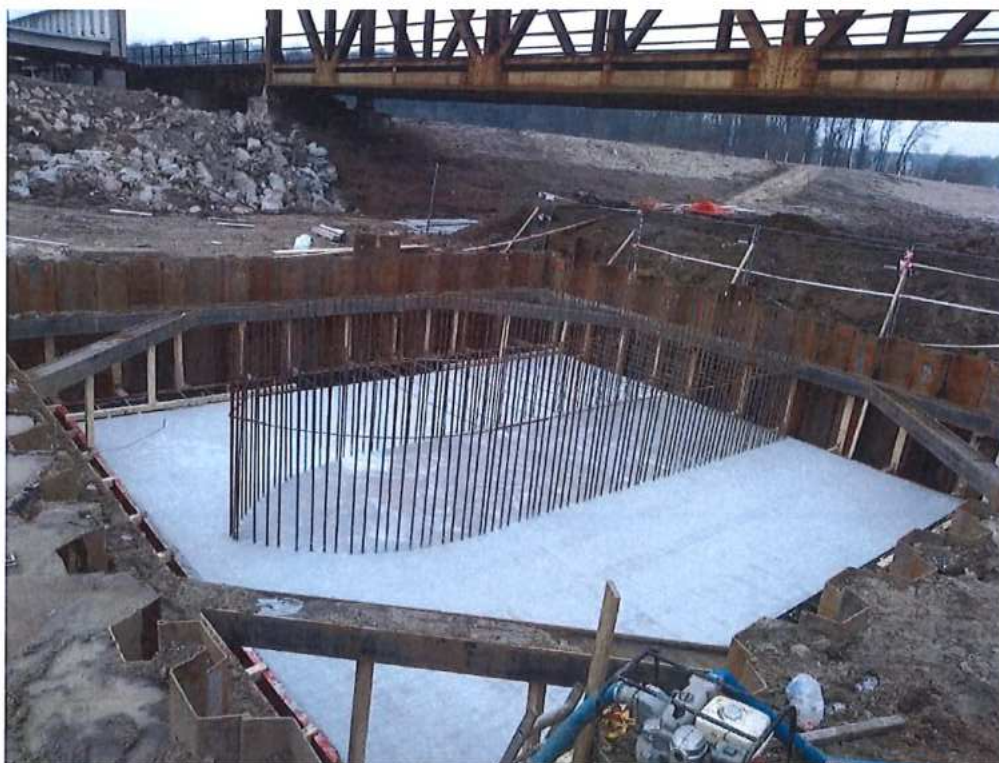
Zabetónovaný základ SO 12-33-04 na strane SK