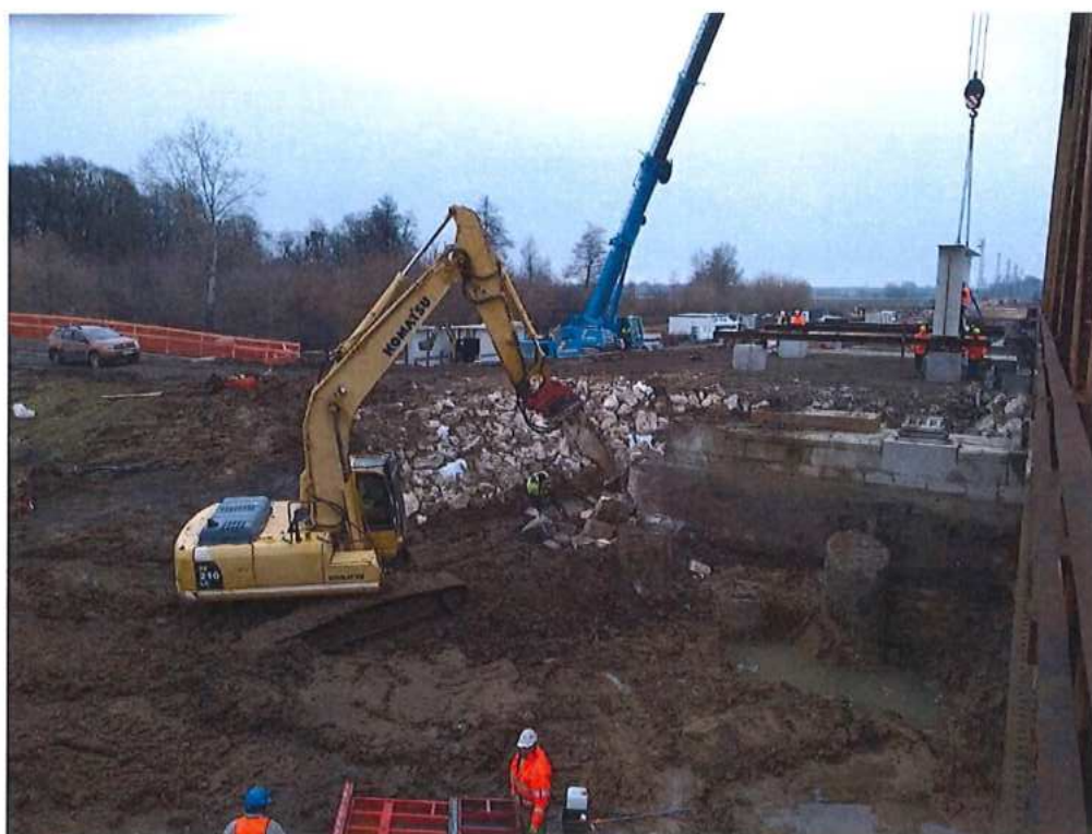
Odbúranie opory SO 12-33-04 na strane SK