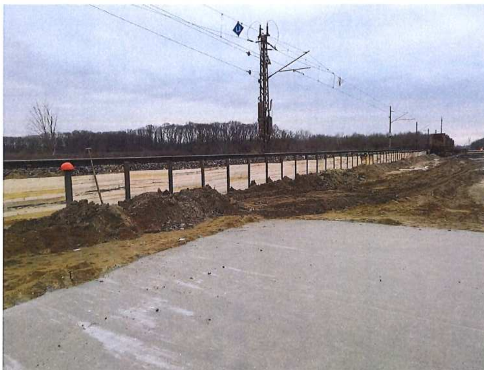
Vkladanie výdrevy v rámci záporového paženia