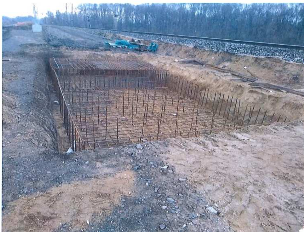
Armovanie základov pre výsun MK SO 12-33-04