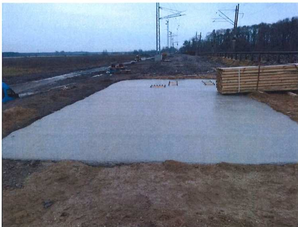
Betonáž základov pre výsun MK SO 12-33-04