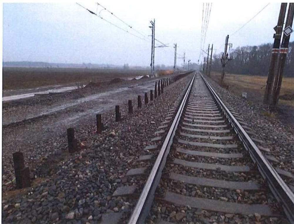
Zriadenie paženia medzi TK 1 a 2.