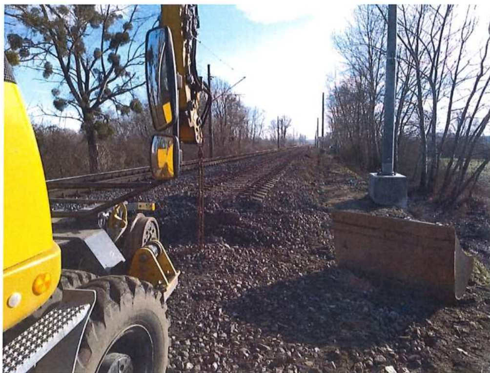
Demontáž a odvoz koľajového roštu v km 72,750 – 73,000 , k.č.1