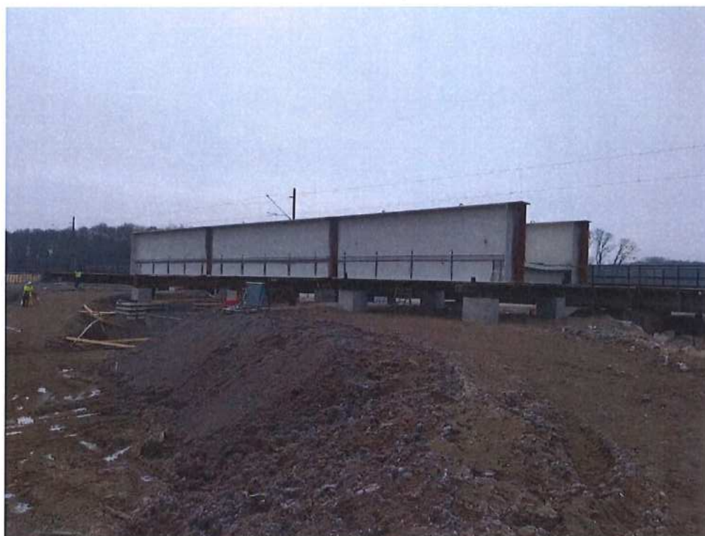
Príprava ocelej konštrukcie mosta SO 12-33-04 na zváranie