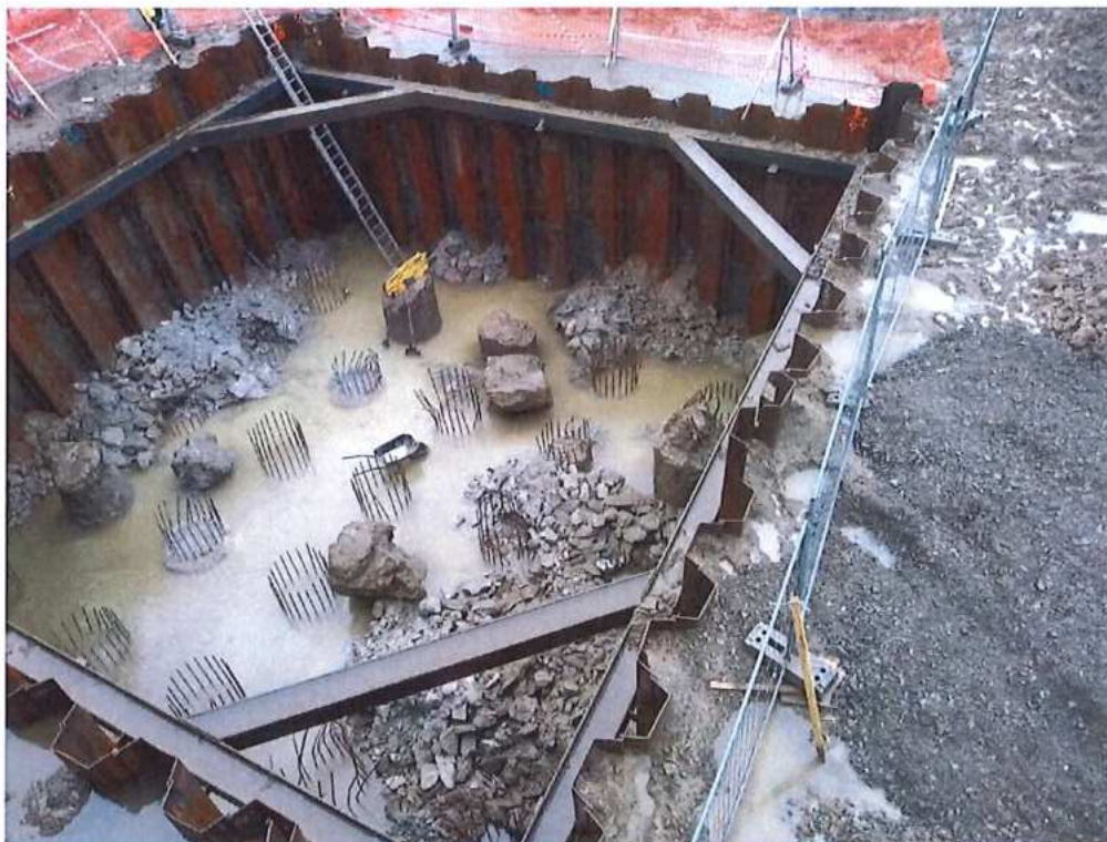
Búranie hláv pilót pre základ SO 12-33-04 na strane SK