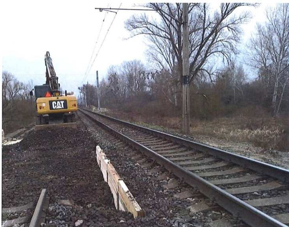
Zriadenie paženia medzi TK 1 a 2