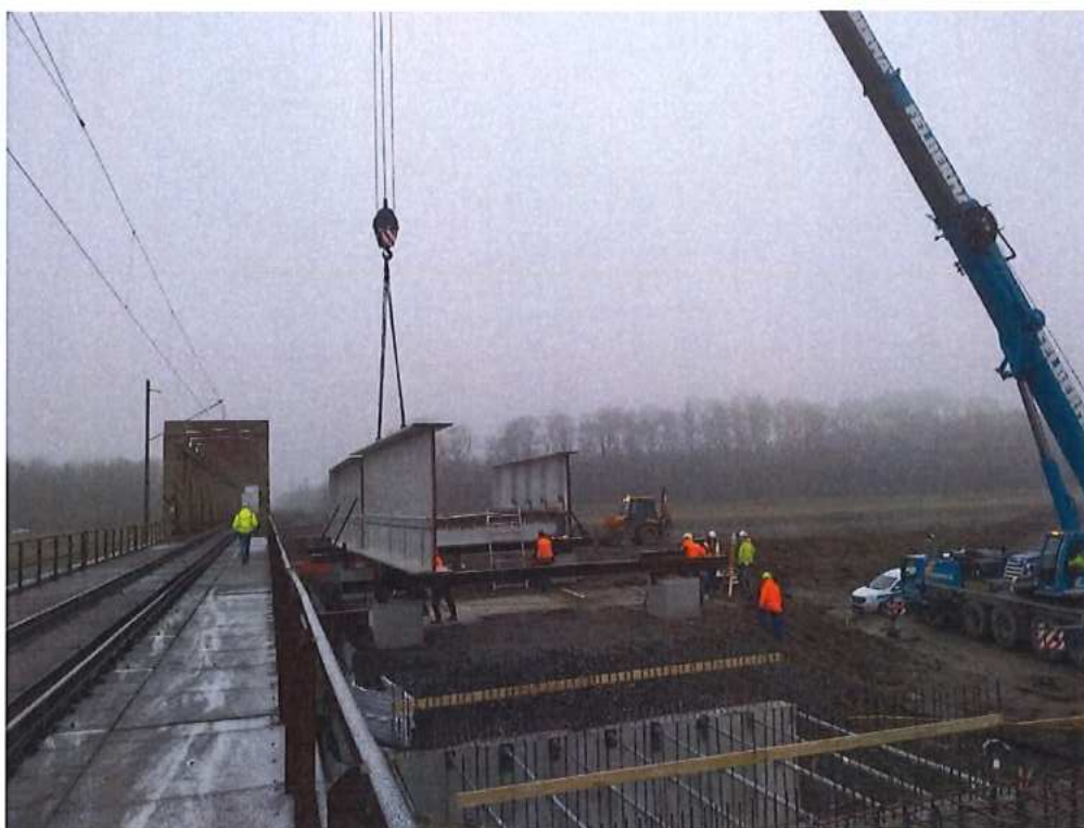
Vykládka ocelej konštrukcie mosta SO 12-33-04